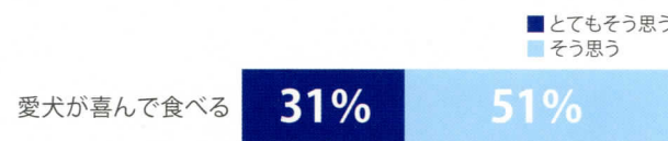
[購入したいサプリメント]

どのような関節用サプリメントを購入したいか調査した結果、実に82%の方が「愛犬が喜んで食べる」サプリメントを購入したいと回答しています。