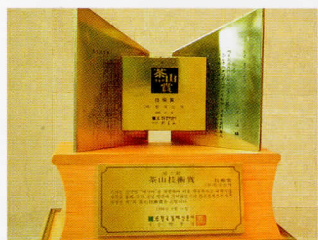
メシマコブの製品化で韓国新薬が「茶山賞」を受賞

ことをつきとめ、この菌糸体の液体大量培養に成功しました。現在、韓国新薬はこれを製品化した国の認証を得て医療機関に提供しています。日本においても原料を輸入し顆粒化され、サプリメントとして多くの人に愛用されています。