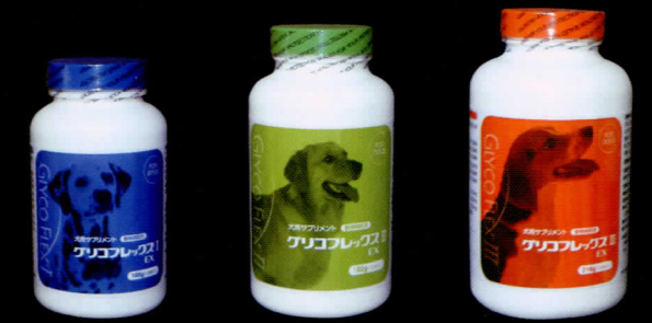
Basic stage Intermediate stage Advanced stage

グリコフレックス I EX グリコフレックス II EX グリコフレックス III EX