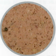
猫 腎臓用 [FKW]