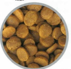
猫 腎臓用 [FKD]