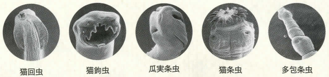
猫回虫 猫鉤虫 瓜実条虫 猫条虫 多包条虫