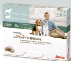
560mg (L) (犬: 9kg~<18kg)