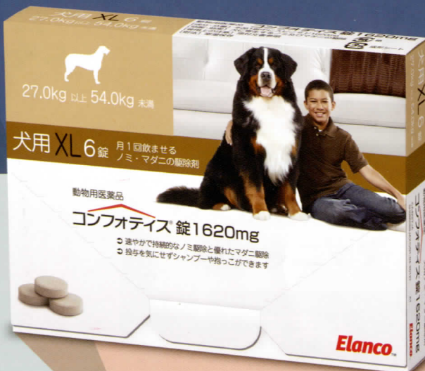
1620mg (XL) (犬: 27kg~<54kg)