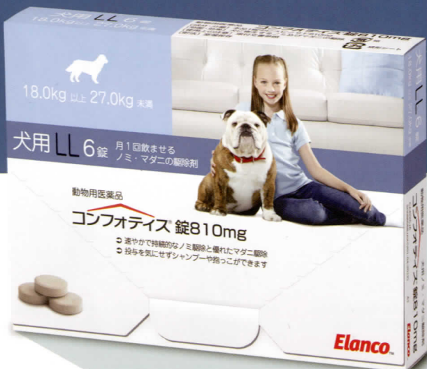
810mg (LL) (犬: 18kg~<27kg)