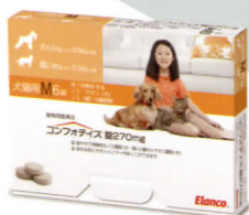
270mg (M) (犬: 4.5kg~<9kg)