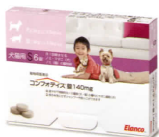
140mg (S) (犬: 2.3kg~<4.5kg)