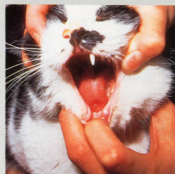
“インターキャット”治療後(7日目)