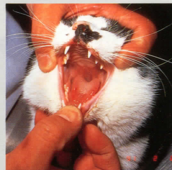
“インターキャット”投与前